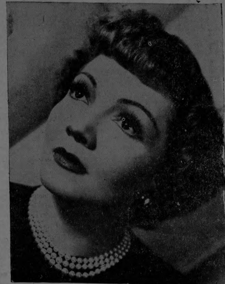
Su rostro podrá presentar el aspecto fresco y descansado que muestra en esta foto la adorable estrella de Hollywood, CLAUDETTE

A la altura de sus obras sinfónicas se encuentra su música de cámara que comprende dos sextetos, dos quin-