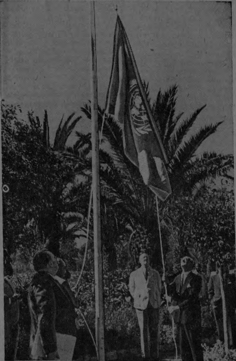
Escena en el momento de izar la bandera azul y blanca de las Naciones Unidas en Asmara, capital de Eritrea. El acto señala el comienzo de las labores de la Comisión de las Naciones Unidas en Eritrea para determinar la voluntad de sus habitantes y hacer recomendaciones sobre el futuro político de esta antigua colonia italiana.