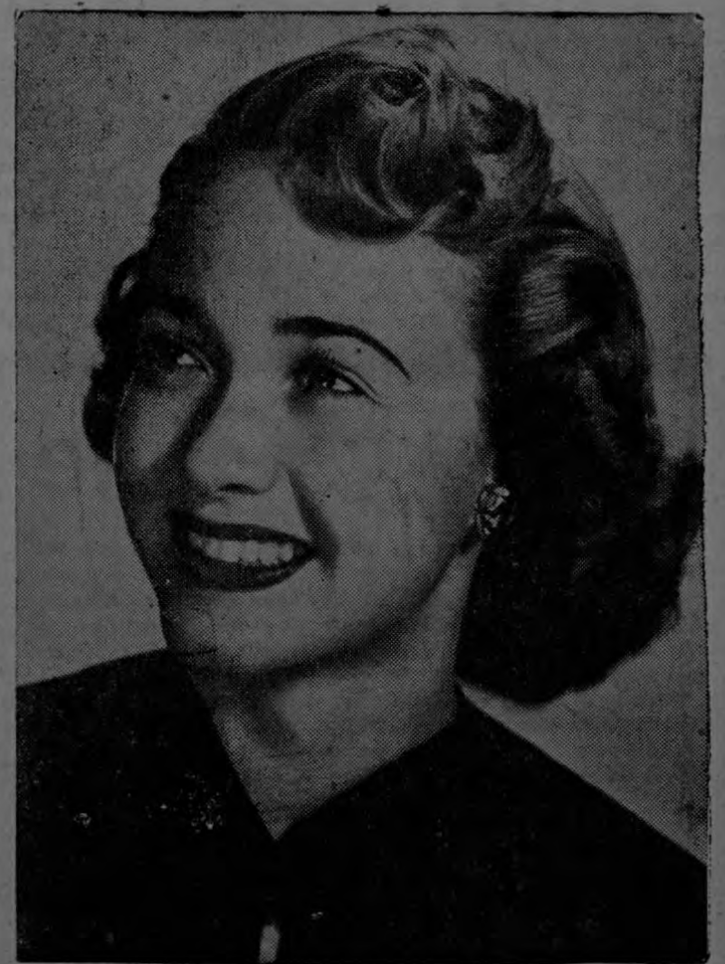
JANE POWELL, ESTRELLA DE LA METRO GOLDWYN MAYER

La agraciada Jane Powell manifiesta por todas las muchachas que laboran ya sea en el mundo de los negocios o en el del arte, y que están próximas a casarse o acaban de hacerlo. La circunstancia de que ella viva en Hollywood y las